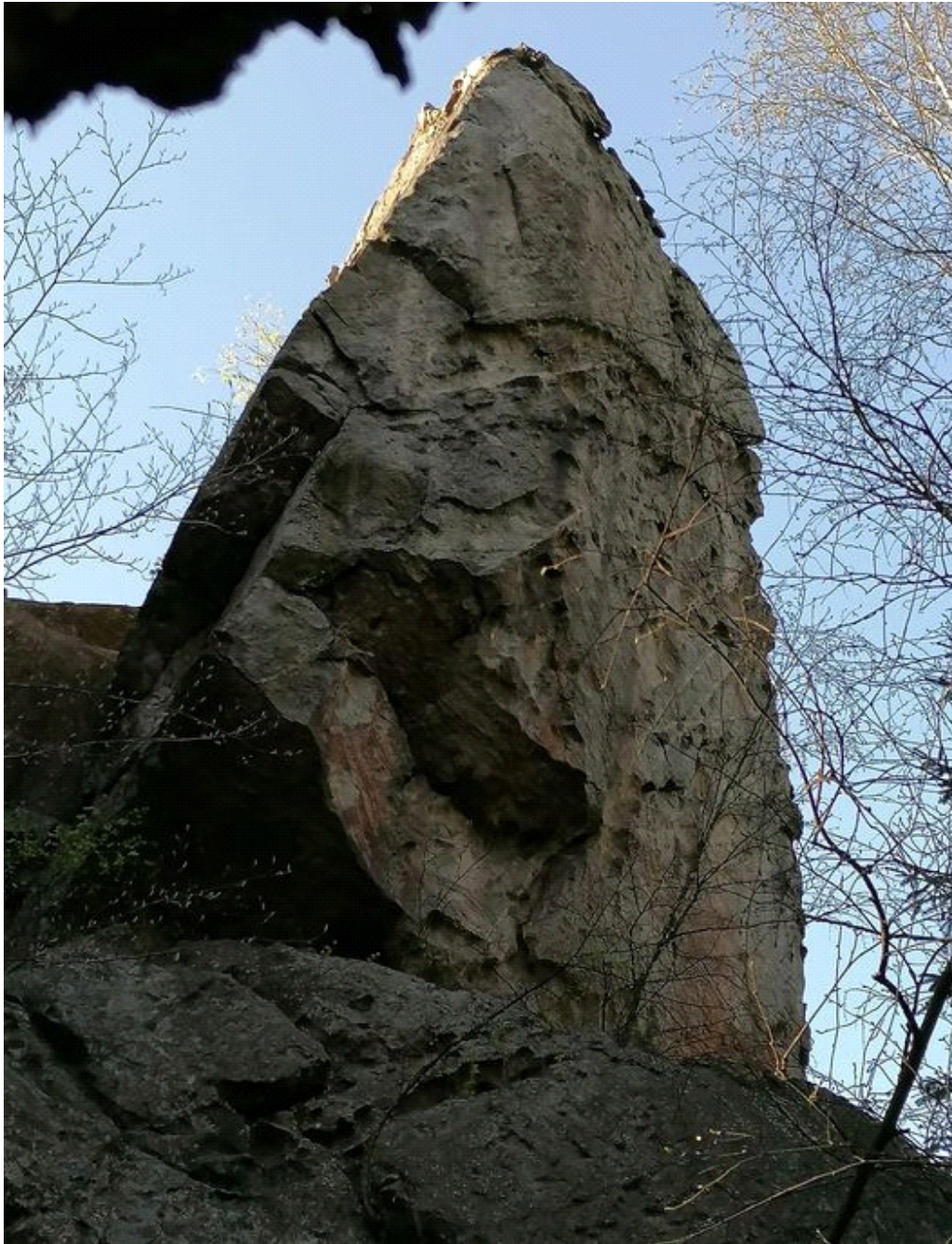
Obrázek č. 1/1