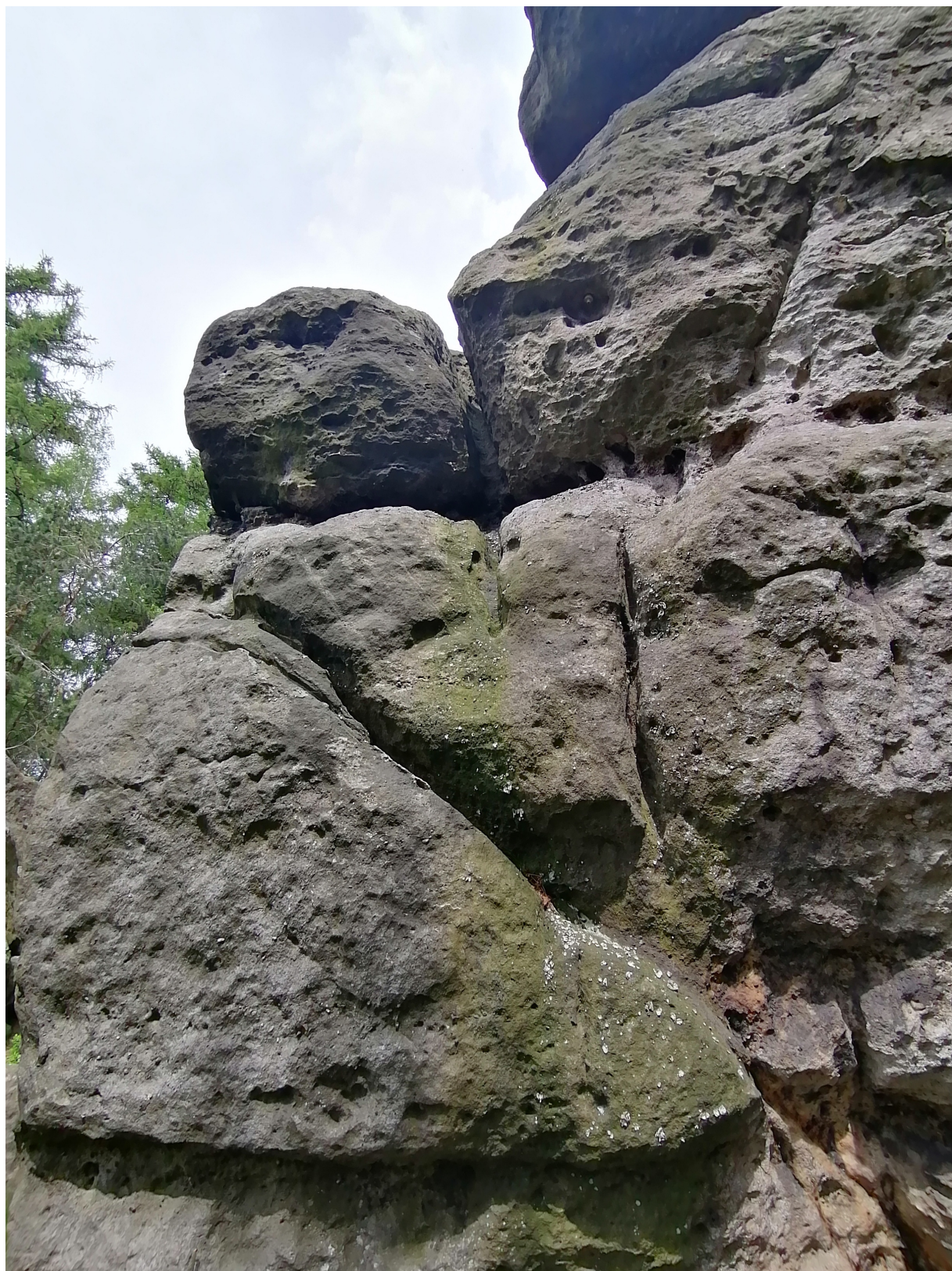
Obrázek č. 1/1