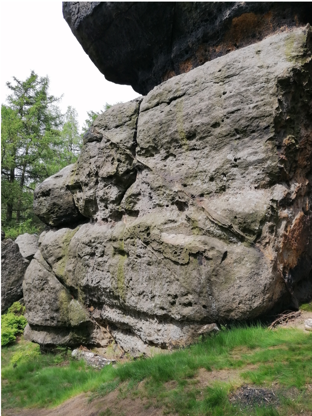
Obrázek č. 1/2